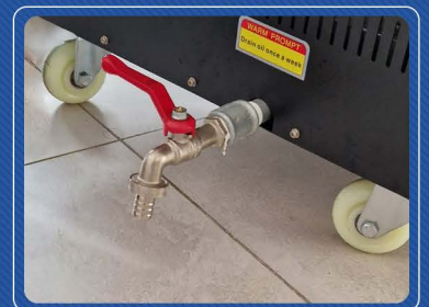
Ruote per un facile posizionamento e sistema di raccolta dell' olio