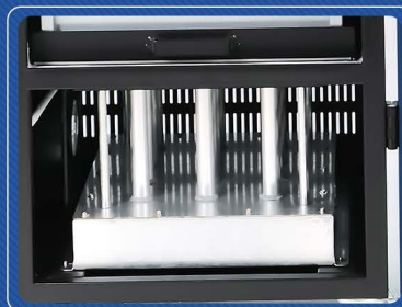
Filtro a carboni attivi